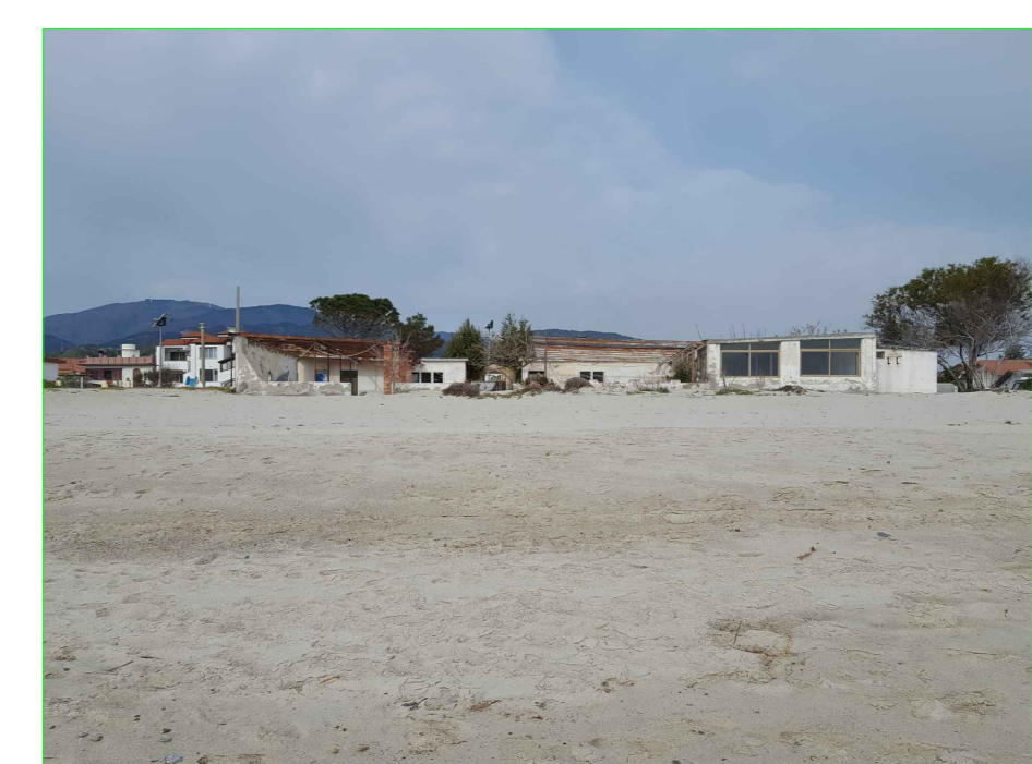
PUNTO DI VISTA F1